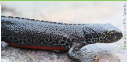
Triton alpestre / P.M. Aubertel