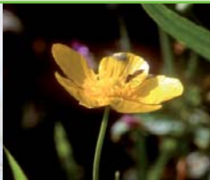
Renoncule Grande Douve / M. André