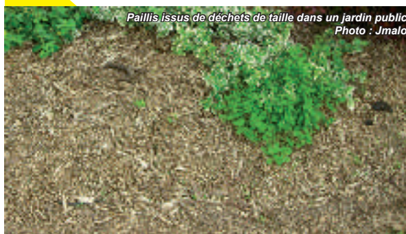
Paillis issus de déchets de taille dans un jardin public

Le « paillage » est simple et peu coûteux. Cette technique consiste à recouvrir le sol de déchets organiques broyés pour le nourrir et/ou le protéger. Il évitera le développement des mauvaises herbes et créera une rétention de l'humidité au niveau du sol.