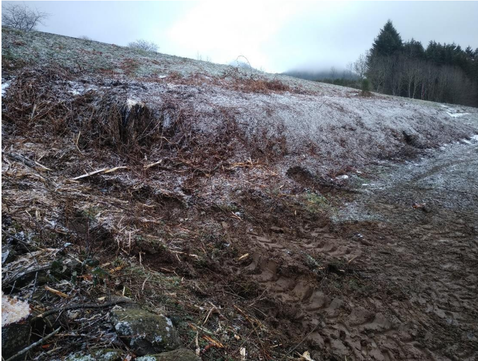
Photo2 : 15 janvier 2021 à 11h21/ 45,08129N 4,06752 E/ Azimut 80°