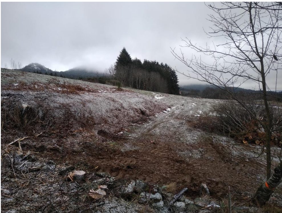
Plan plus large au même endroit avec le tas de branchage sur la droite.