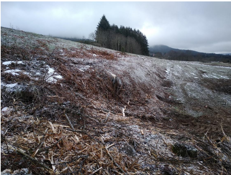
Photo1 : 15 janvier 2021 à 11h17// 45,08129N 4,06752 E/ Azimut 135°