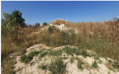
Dépôts déchets inertes sur parcelle 003_bis