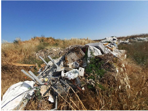
Déchets DIB récents sur parcelle 003