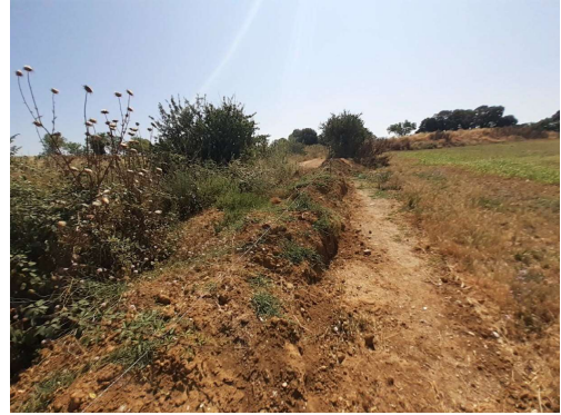
Dépôts de terre condamnant accès parcelles