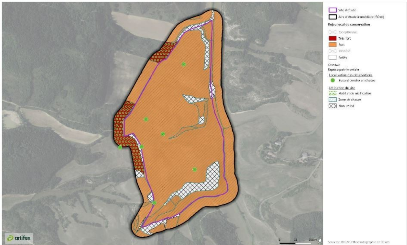
Figure 3: Cartographie des habitats utilisés par le Busard cendré

Enfin, considérant la destruction de l'habitat de reproduction du Busard cendré, la mesure de conservation d'un habitat favorable ne peut être qualifiée de mesure de réduction mais bien de mesure de compensation.