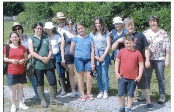
Participants à la découverte des petites bêtes des mares communales.

🌀 17 passages presse (journaux et radio).