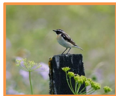
Tarier des prés Photo : F. Soulon, N18