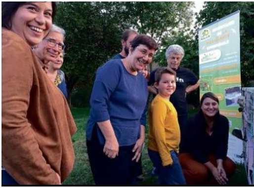
Evènement 50 ème IBC de la Région Centre-Val de Loire

🌀 1 évènement régional pour célébrer l'engagement de Marçais en tant que 50 ème commune IBC de la Région Centre - Val de Loire, en septembre 2017.