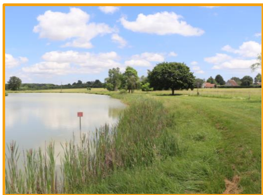
Etang communal du Charme

Situées à l'Est du département du Loiret, les deux communes sont à l'écart des grandes agglomérations au sein de la région agricole de la Puisaye.