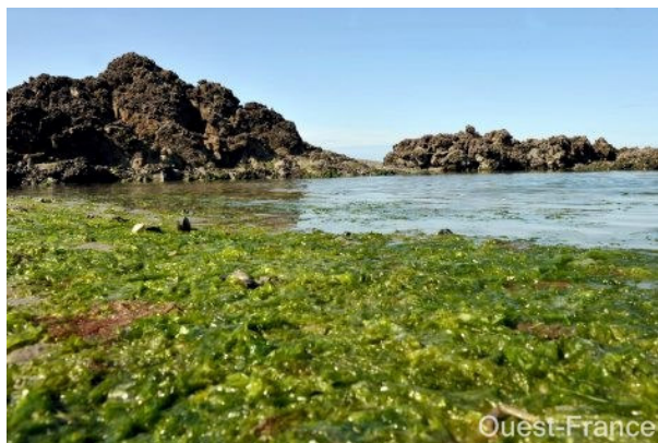
Figure 1 : Aspect des algues vertes fraîchement échouées, Côtes d'Armor