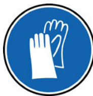
Port de gant