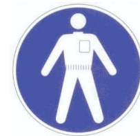
Port de vêtements de protection