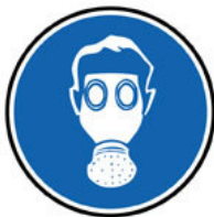
Port du masque