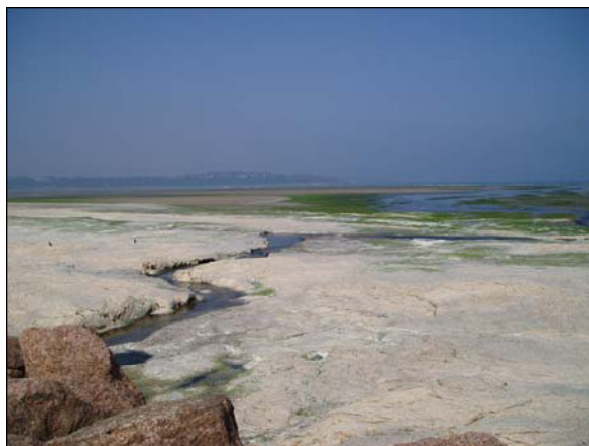
Figure 2 : Croûte blanche en surface d'un dépôt d'algues en putréfaction

Les micro-organismes sulfato-réducteurs, très abondants en eau de mer, vont utiliser les sulfates présents dans les algues et le milieu marin comme source d'oxygène, ce qui entraîne la formation de sulfure d'hydrogène ( H_2S ). Un mécanisme parallèle aboutit à la formation d'ammoniac ( NH_3 ) à partir des nitrates.