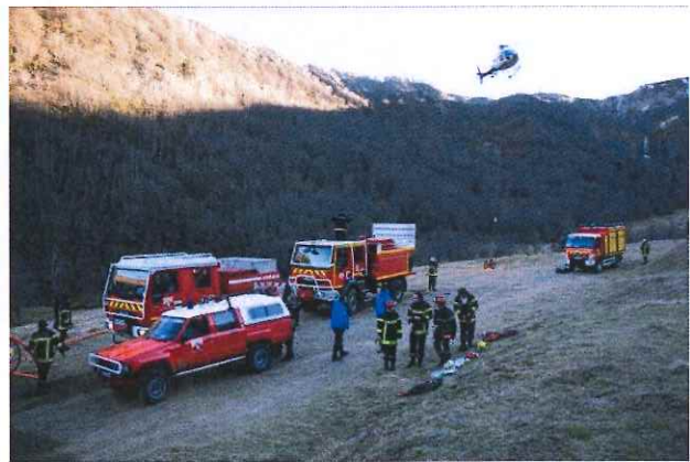
Intervention de l'hélicoptère bombardier d'eau