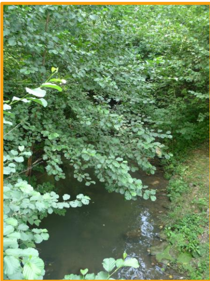
Vallée Courtineau

Sainte-Maure-de-Touraine est située à égale distance (34 km) de la préfecture Tours et des sous-préfectures Chinon, Loches et Châtellerault.