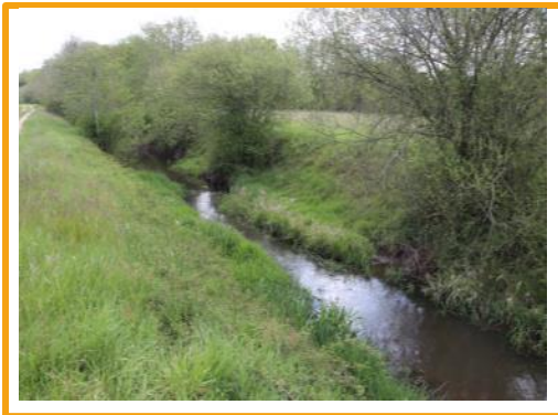
La Bergeresse

Située dans le quart sud-ouest du département du Loiret, à cheval sur le Val-de-Loire et la Sologne, c'est une commune verdoyante, traversée d'Est en Ouest par le Dhuy (qui porte le nom de Bergeresse au niveau de la commune), affluent du Loiret, qui sépare la zone agricole du Val-de-Loire (au nord) de la Sologne, zone forestière émaillée de très nombreux étangs, au sud.