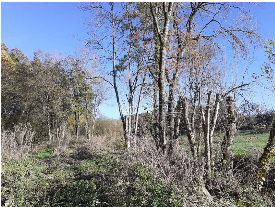
Photo prise en sens opposé, la grée à droite. Les repousses sont visibles sur les arbres. Les fresnes, aulnes, noisetiers repartent.

Bien évidemment en automne les arbres sont plus ou moins dénudés.