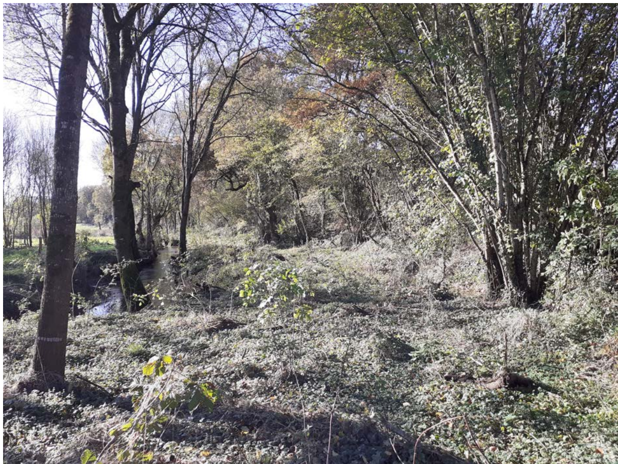
La Grée à gauche, le pont derrière

Vous trouverez ci joint quelques photographies prises le 17 novembre 2023 en bas de la Cordinière