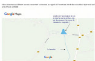
Carte google Le JACquelin envoi mairie.jpg 38K